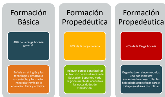
Esquema No.4: Reforma de los Bachilleratos Tecnológicos (2004).