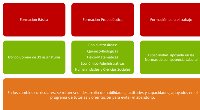
Esquema 5: Reforma del Bachillerato General (2003)