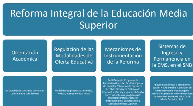
Esquema No.1: La Reforma Integral de la Educación Media Superior