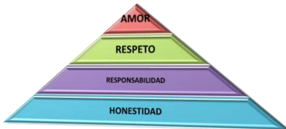
Figura 3. Propuesta de Innovación Educativa en Cuatro Valores.

Aunque todo lo dicho anterior se ha venido desarrollando en una u otra manera, pareciera que se ha olvidado un pequeño detalle, que cuando el docente toma como fin la tecnología para la enseñanza se llega a perder, cuando se disuelve el valor o sentido de la enseñanza, cuando el docente inicia un trabajo día a día mecanizado, automáticamente realiza una rutina, prepara contenidos, responde correos, asigna actividades, etc. Llega a olvidarse de quien es el receptor del conocimiento, dejando al discente aislado, existiendo solo una comunicación por vía electrónica si es que esta es enviada a tiempo o con cierta frecuencia, en caso contrario hasta el final del curso se vuelve a saber del docente y es cuando asigna una evaluación que puede o no ser agradable al discente.