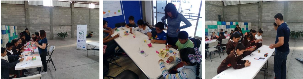
Figura 2. Estudiantes de ISC impartiendo talleres didácticos en comunidades

Los estudiantes de ISC desarrollaron actividades didácticas con material adquirido en el mismo programa, como cubos de Rubik, torres de hanói, memorama informático y un reto llamado criptografía , en el que se descubre un mensaje aplicando técnicas básicas como el intercambio de caracteres. En la figura 2 se pueden observar algunas evidencias fotográficas de este tipo de actividades.