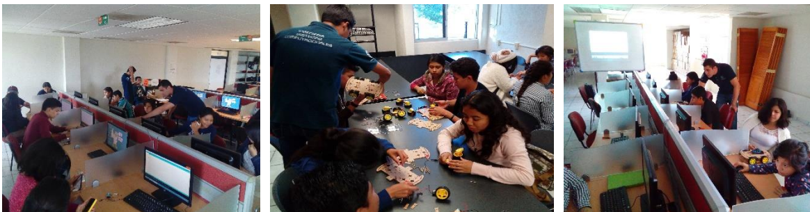
Figura 1. Estudiantes de ISC llevando el rol de talleristas en programas educativos

Para los estudiantes de la carrera de Ingeniería en Sistemas Computacionales este programa, así como la vinculación de la Sices ofreció los siguientes beneficios: 1) ser partícipes de un programa estatal con reconocimiento y calidad; 2) fungir como talleristas y ponentes en el congreso final del Club de Ciencias; 3) desarrollar sus competencias adquiridas en materia de desarrollo humano y electrónica; 4) ser líderes proactivos en beneficio de su comunidad e institución; 5) obtener materiales de su interés para sus materias y recursos financieros, y 6) fortalecer puntos obligatorios para su futura titulación como créditos de desarrollo humano o servicio social.