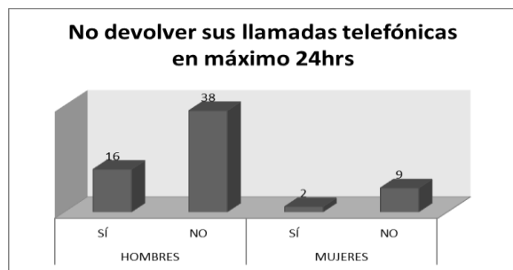
Figura 2. Elaboración propia

Cabe señalar que el resto de los errores son en menor porcentaje; sin embargo el resultado de la observación es la siguiente, los 65 estudiantes son únicamente 20 de ellos los que se ocupan y revisan su imagen física, considerando la ropa, los zapatos, los accesorios, la higiene, de ellos son 5 mujeres las cuales cuidan estos aspecto; por otro lado en cuanto a la imagen no verbal, se pudo observar que únicamente 10 estudiantes, han demostrado el cuidado de su imagen, al establecer una postura adecuada, atender la mirada con seguridad, la forma de sentarse, el saludo es cordial, emitir una sonrisa de cortesía, los cual únicamente 2 mujeres se encuentran dentro de los 10 estudiantes.